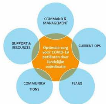
Figuur 1: Organisatiestructuur LCPS